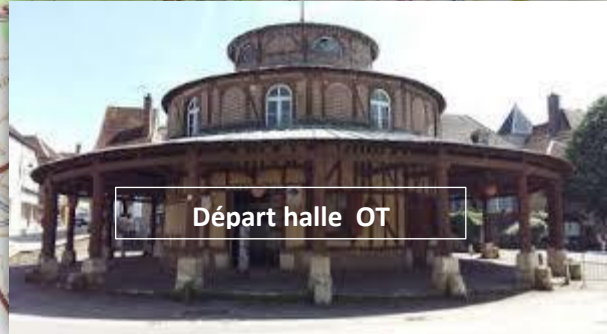
Départ halle OT