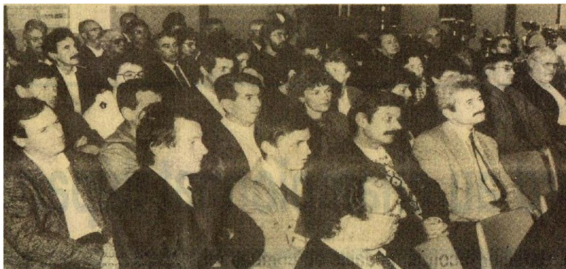
C'est « un peloton » particulièrement fourni qui assista à la traditionnelle assemblée générale du V.C.S. qui réussit une saison remarquable