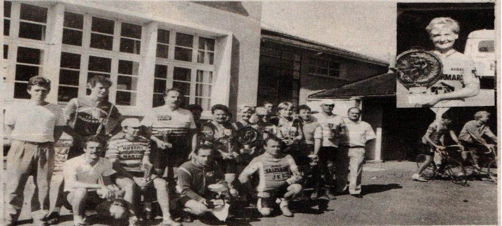
A l'heure des récompenses. En médaillon, l'heureuse représentante des Audax avec le superbe challenge Verrière.

360 participants dont 50 féminines, 25 clubs représentés + 53 indépendants ont assuré le succès de notre 5e concentration dotée du superbe Challenge de la Boulangerie Verrière.