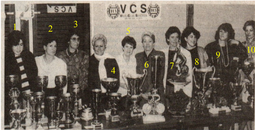
L'équipe féminine sancéenne à l'honneur derrière les nombreux trophées qui furent remis lors de l'assemblée