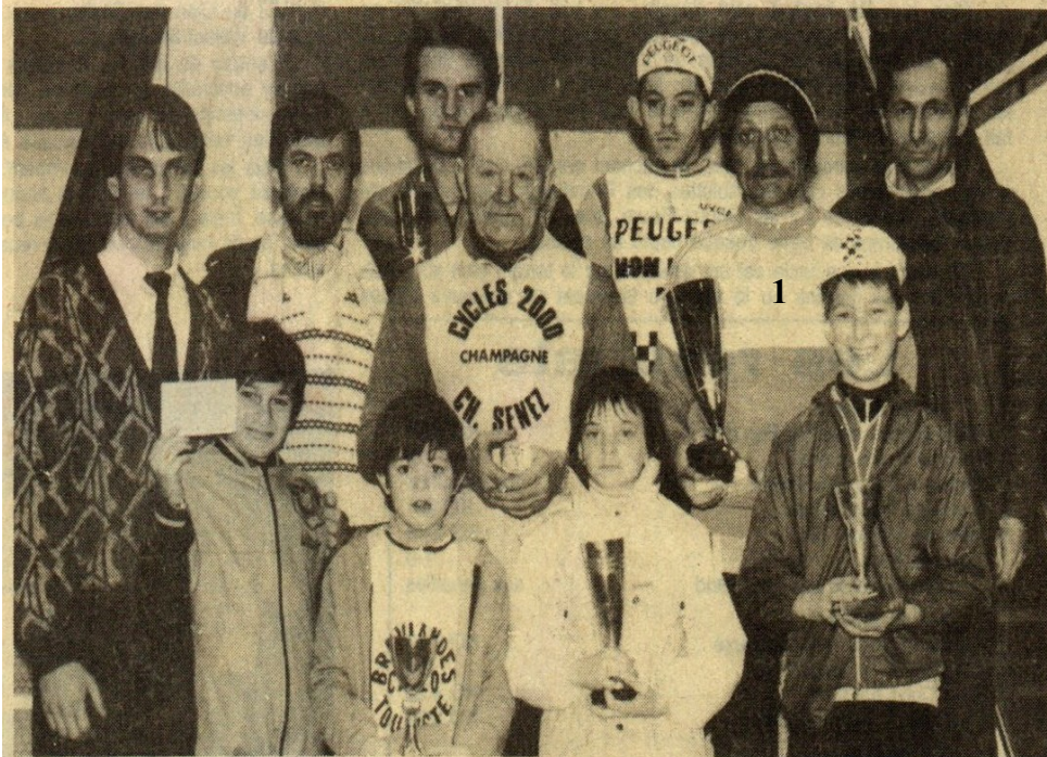
Les vainqueurs des coupes offertes par Flunch et le Bon Pain de France

Les dirigeants de l'ASPTT Cyclotourisme ont toutes les raisons de se montrer satisfaits de la Randonnée Flunch qui s'est déroulée dimanche matin.