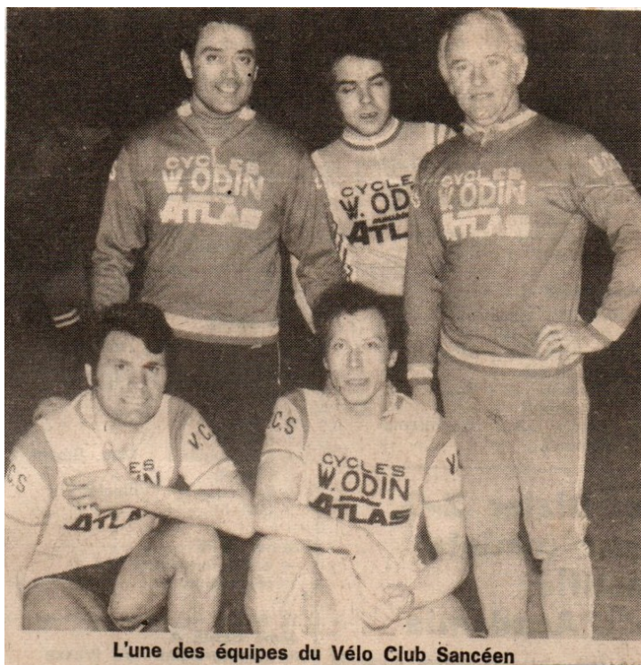
L'une des équipes du Vélo Club Sancéen